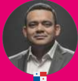
MAYOR WLADIMIR GONZÁLEZ